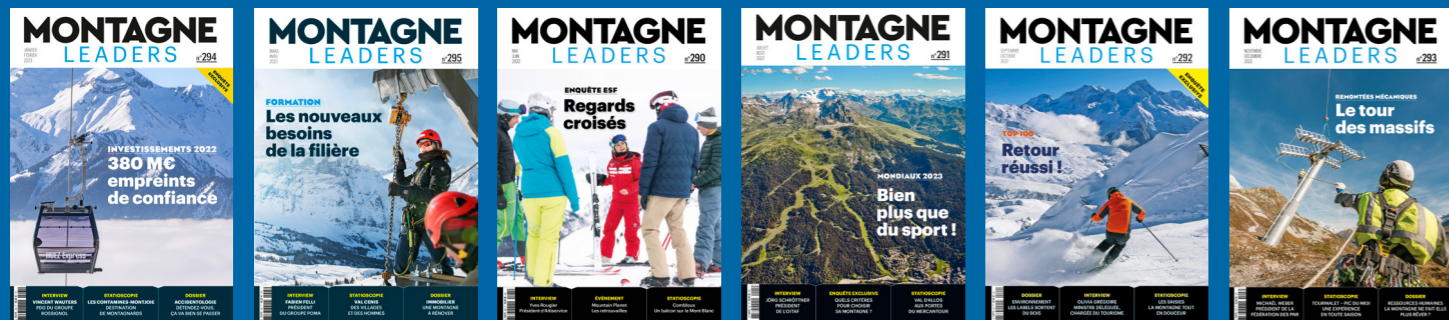
Janv./Fév. Enquête investissements en station. Exclusivité nationale avec DSF et Atout France Mars/Avril 2024 : Mountain Planet 2023 Alpiro / Interpin Mai/Juin Nouveautés Interpin Enquête tourisme en stations Juil./Août international : Salzbourg. Diffusion : AG ADSP + golf interstations Sept./Oct. Diffusé au congrès de Domaines Skiables de France. Enquête Top 100. Nov./Déc. Dernières remontées mécaniques, rétro congrès DSF.